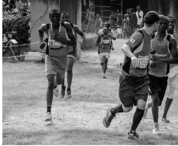
Deelnemers aan een Muskathlon dit jaar: Amsterdam-Ede-Kabale-Kampala-Kigali

In de context van de ruige (!) natuur wordt een beroep gedaan op uithoudingsvermogen, kameraadschap en onderlinge solidariteit. De uitputtende en avontuurlijke tocht eindigt bij een opgericht kruis op een heuvel. Daar laten mannen symbolisch hun verleden