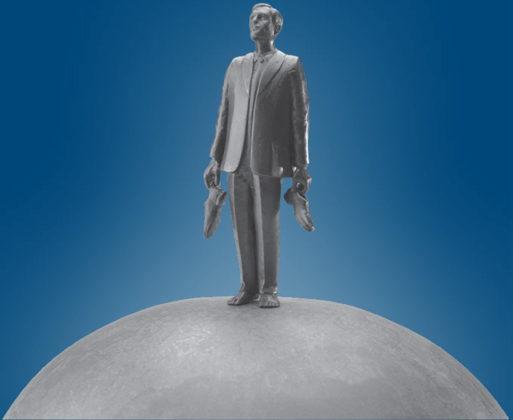
David Robinson, 'On holy ground', brons en staal, 1999, www.robinsonstudio.com