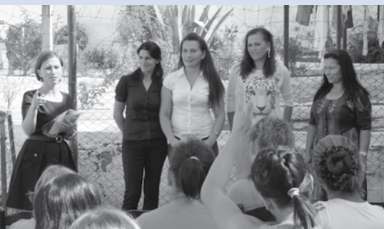
Verhalen van hoop in de vrouwen- gevangenis van Tirana

Vaak wordt er geklaagd over de vergrijzing en leegloop van de kerken in Europa. Uit allerlei officiële rapporten blijkt dat het aantal kerkgangers op veel plaatsen in Europa afneemt. Maar is dit de enige manier om tegen de situatie aan te kijken? Op veel plekken is de kerk juist nog steeds (enthousiast) aanwezig. Op andere plekken zien we een opleving, vernieuwing, gemeentestichting. De kerk is door crises als communisme en secularisatie heen gegaan, maar is er nog steeds en bloeit op veel plaatsen ook weer op.